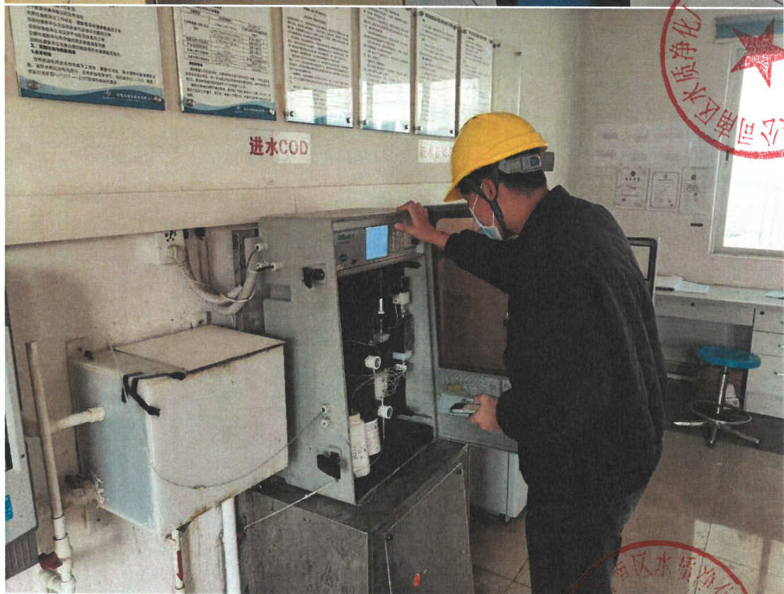
珠海市城市排水有限公司南区水质净化厂